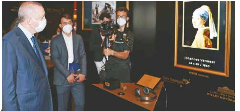
Cumhurbaşkanı Erdoğan, öğrencilerle birlikte Cumhurbaşkanlığı Millet Kütüphanesi'ndeki Türk Telekom'un, görme engellilere yönelik hazırladığı sesli beşitemeli eserlerden oluşan “Tablolar Konuşuyor Dijital Resim Sergisi”ni gezdi.

“NATO Zirvesi bizim için gerçekten çok çok anlamlıydı. Bu zirvenin içerisinde olan liderlerle de ben demeyi pek sevmem ancak en kıdemli lider bendim. 18 yıl geçti, her yıl birçok lider, siyasetten