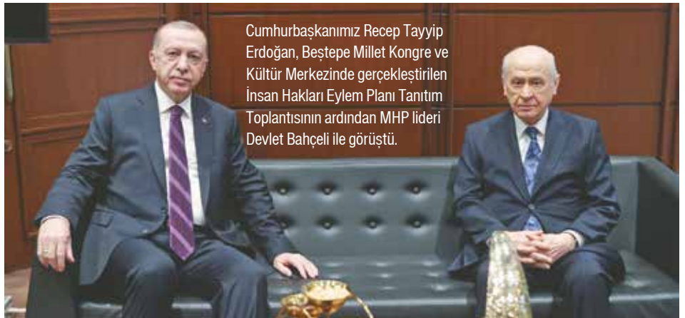
Cumhurbaşkanımız Recep Tayyip Erdoğan, Beştepe Millet Kongre ve Kültür Merkezinde gerçekleştirilen İnsan Hakları Eylem Planı Tanıtım Toplantısının ardından MHP lideri Devlet Bahçeli ile görüştü.